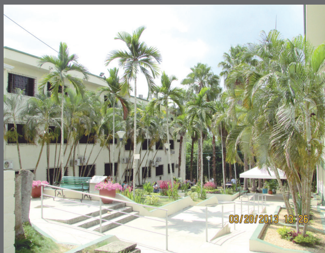
Bloque de Educación Virtual

La Corporación Universitaria del Caribe - CECAR - está ubicada en un lote de 12 hectáreas, a la salida de Sincelejo vía Corozal. Sus 4 facultades y sus 15 programas presenciales y 9 virtuales, funcionan en 7 edificios y otras construcciones, en un ambiente agradable, arborizado, que le da a su campus universitario un toque de distinción particular.