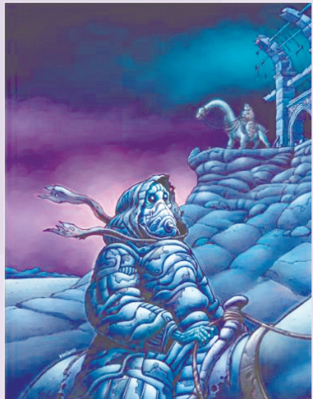
Dibujo de Giovanni Castro (Nigio)

Y refieren que regresaron silbando extrañas melodías de arena y que se sintieron defraudados y que decidieron, con el dolor de sus antenas, quemar las páginas mal escritas de esta historia y comenzar de nuevo.