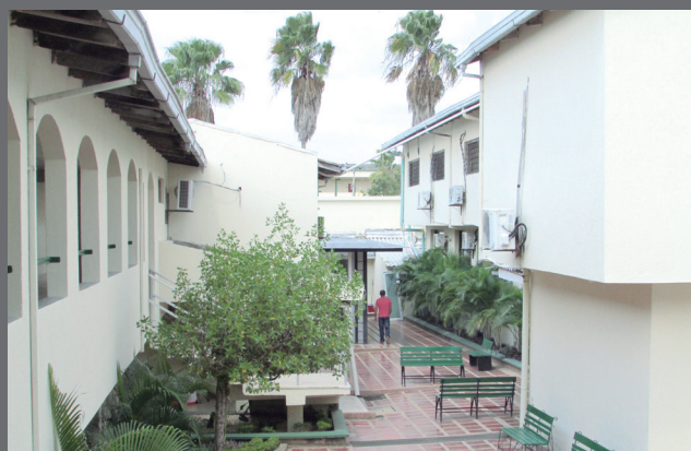
Patio Interior del Edificio Administrativo