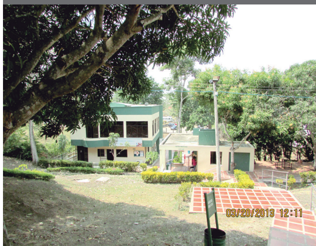
Centro de Idiomas