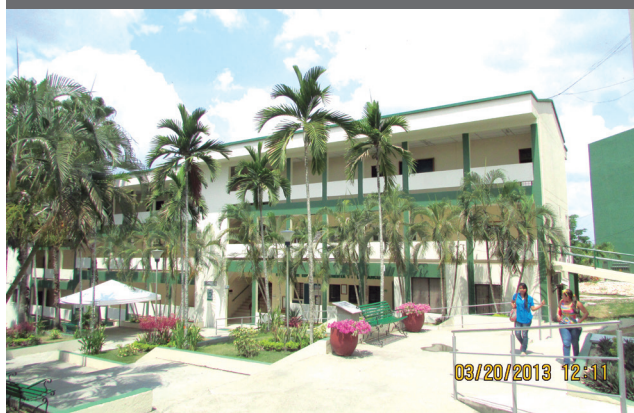
Bloque de la Facultad de Derecho